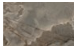
CM4 - Alabastro lucido/ Glossy Alabastro