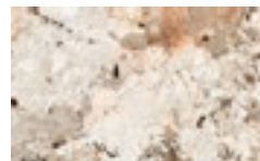
CM10 - Patagonia lucido/ Glossy Patagonia